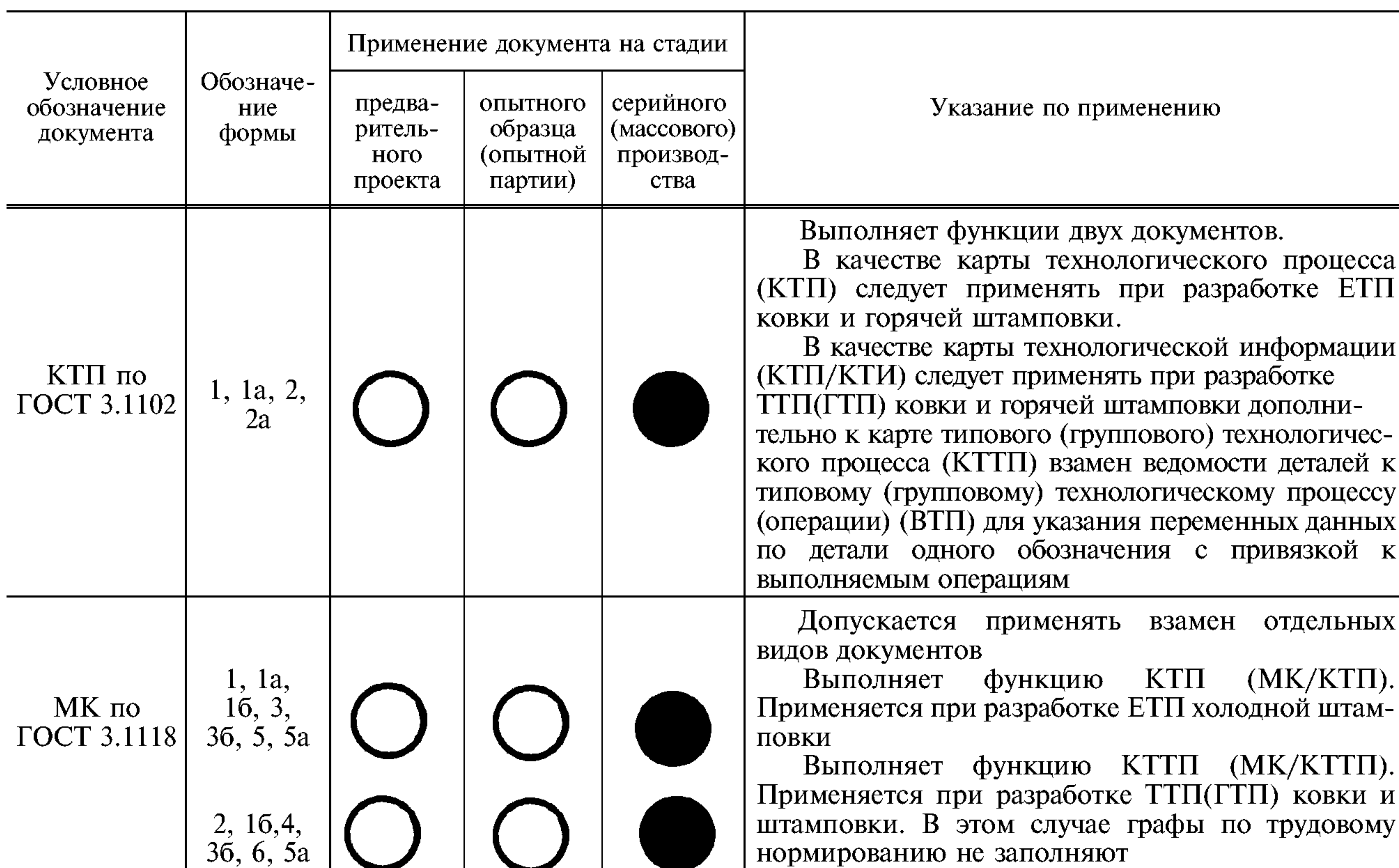
Т а б л и ц а 1

1.1. Виды и назначение технологических документов (далее — документов), разрабатываемых с применением различных методов проектирования на технологические процессы (далее — процессы)ковки и штамповки, приведены в табл. 1.