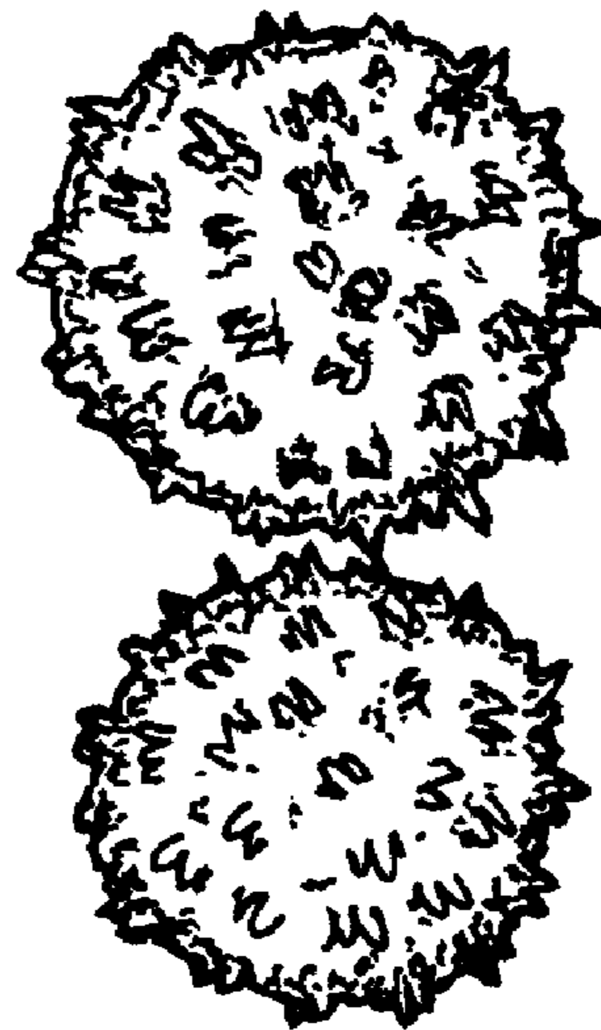
Рисунок 2 — Пыльцевые зерна хлопчатника ( Gossypium hirsutum L.)